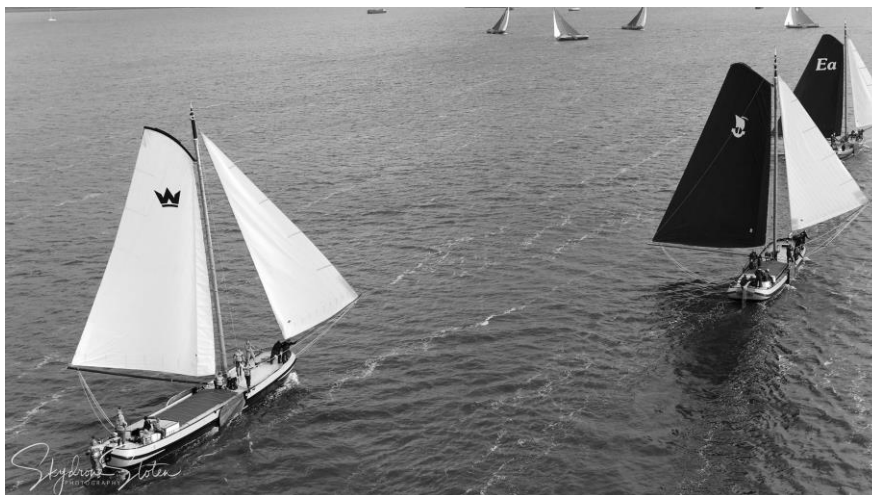
In nije diminsje, mei in drone de loft yn